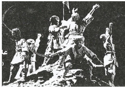
Şekil 2: Serbedârilerin zaferlerini anlatan bir tasvir (Eminzade, 1384/1964, 325).

İbn Arabşah (2012, 66) ve Netenzi'nin (1336/1918, 158-159) eserleri incelendiğinde de Serbedâl (سريدال) olarak ifade edilen bu grup, Horasan'ın büyük kısmını zapt eden maceraperest çete reisleri olarak tanımlanmaktadır. Serbedâl'in Ser (سر) ve Abdâl (ابدال) kelimelerinin birleşiminden oluştuğunu, Abdâl'in baş/reisi anlamı taşıdığı, tasavvufta derecelendirmeyi işaret eden bir terim olduğu da ifade edilmektedir (Uludağ, 1998, I, 59-61). Serbedârilerin dinî zemini olan bir siyasetin içinden çıkmaları Serebdâl kelimesinin Serbedârilerle ilişkilendirilmesini anlamlı kılmaktadır. Abdâl kelimesinin Müslümanları koruyan delikanlı ve pehlivan kişiler için kullanıldığı (Ajend, 1985, 353) göz önüne alındığında Serbedârî hareketinin taraftarlarının da çoğunlukla genç ve pehlivanlardan oluşması nedeniyle onlara bu adın verilmiş olması kuvvetle muhtemeldir (Ahençi, 1384/1964, 132-133). Onların soyu baba tarafından Hz. Hüseyin'e anne tarafından ise Bermekîlerden Yahyâ b. Hâlid'e dayandırılmaktadırlar (Beyânî, 1370/1950, II, 758-78; Emânî, 1995, 89).